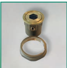
MS-Pumpenkugelhahn Brass pump valve