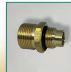
Strömungsdüse für HK-Verteiler Adapter for manifolds m/m