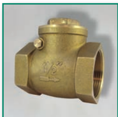
MS-Klappen- rückschlagventil IG/IG Brass swing check valve threaded f/f