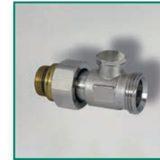
Einzelblock Durchgangsform Single pipe valves