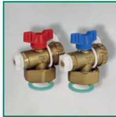
KFE-Ventil 2-er Set, mit Entlüftung Set of fill and drain valves with vent valve