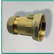
MS-Pumpenkugelhahn Brass pump valve with compression connector