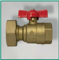
MS-Pumpenflansch-Multihahn 2 x IG Ball valve with union f/f