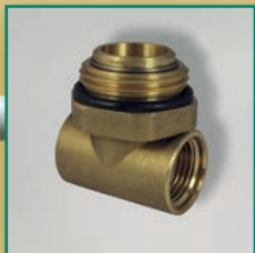
MS-T-Stück drehbare Kopfverschraubung IG/AG/IG Male end fitting rotating, for manifolds f/m/f