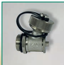
FE-Ventil leichte Version, drehbar Fill and drain valve light version, rotating