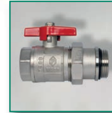
MS-Kugelhahn vernickelt oder blank, voller Durchgang Ball valve full flow with o-ring, for manifolds