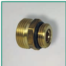
Reduziernippel AG/AG Adapter for manifolds m/m