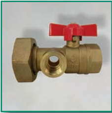
MS-Pumpenflansch-Multihahn 2 x IG, 2 Thermometermuffen Ball valve with union f/f 2 junction sockets for thermometer wells