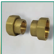
MS-Pumpen- verschraubungs-Set Connection fittings for pumps (set)