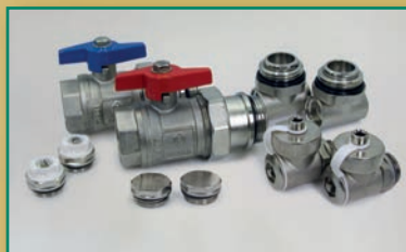
Verteiler-Anschluß-Set Mounting kit for manifolds